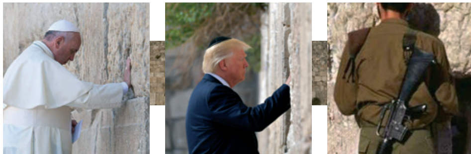
Scener fra Grædemuren - "mange kræfter er i spil" (redaktionen)

det været helt galt. Jøderne accepterede løsningen, men araberne nægtede at acceptere FN-resolutionen og startede den første angrebskrig imod det nye Israel, og tabte og flygtede og blev fordrevet. Men i langt mindre antal end der er fordrevet og udryddet jøder og kristne fra de arabiske stater.