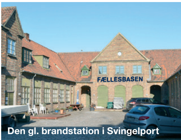
Den gl. brandstation i Svingelport