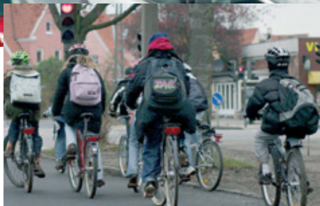
Billederne er indsat af redaktionen

Det burde være selvindlysende for Byrådet, at der af hensyn til sikker trafik bør være tilstrækkeligt med P-pladser ved alle offentlige institutioner, men desværre halter det mange steder. Det kan ikke være penge, der er problemet. Så dyrt er det jo ikke at rydde noget krat og stampe noget stabilgrus med fald til et nedsvingsområde.