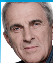
Steen Gade Folketingsmedlem (SF)