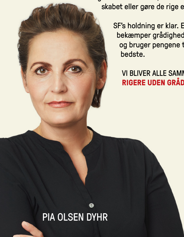
PIA OLSEN DYHR

VI BLIVER ALLE SAMMEN RIGERE UDEN GRÅDIGHED